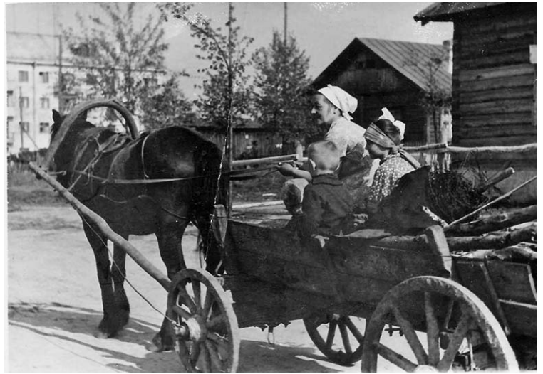
Пересечение улиц Первомайской и Жданова (Гостиной).