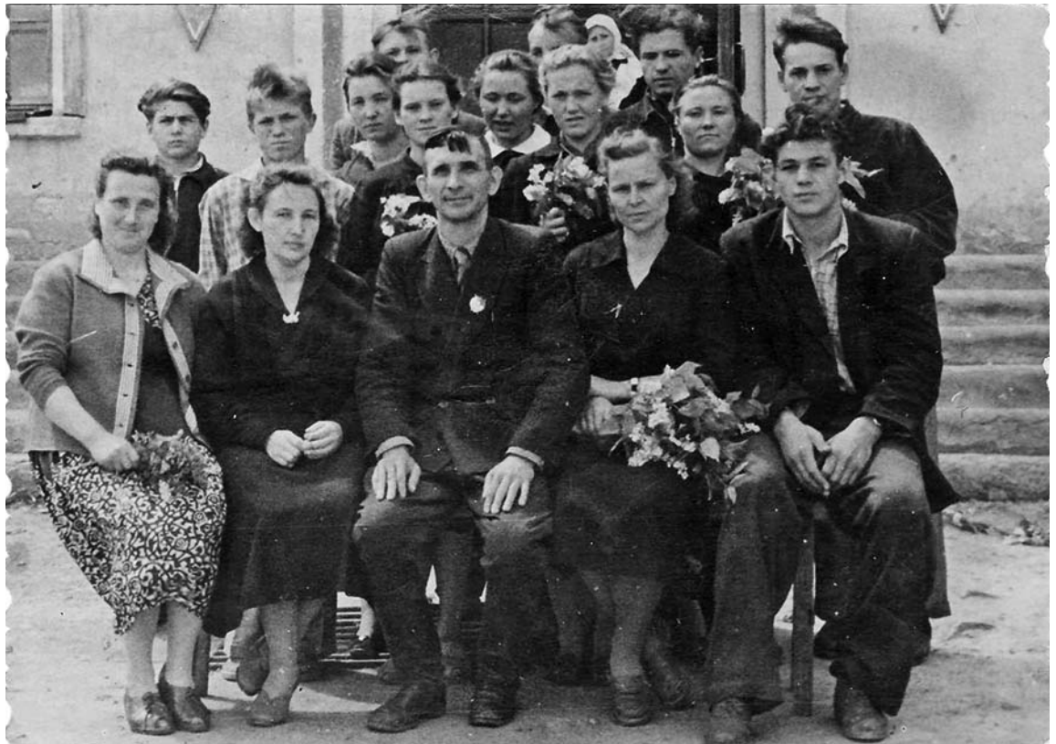
Выпуск Вертненской школы, 1961 год.